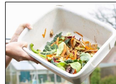
Ostaci voća i povrća