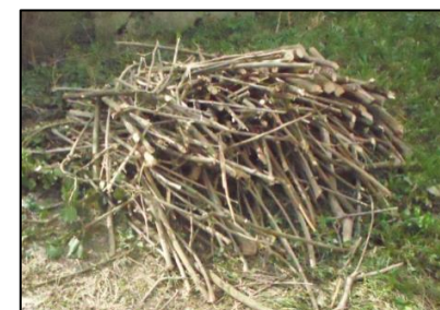
Otpad iz vrta